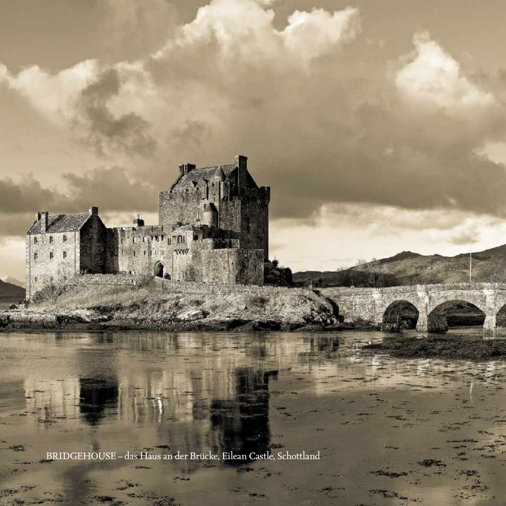
BRIDGEHOUSE – das Haus an der Brücke, Eilean Castle, Schottland